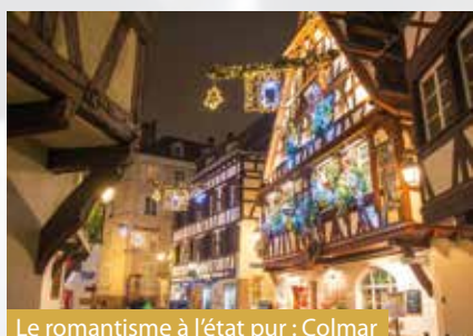
Le romantisme à l'état pur : Colmar