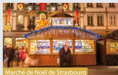
Marché de Noël de Strasbourg

Dispos et repus après une bonne nuit de sommeil et un délicieux buffet de petit déjeuner à bord, il est temps pour vous de quitter votre bateau. Après un trajet agréable jusqu'à Colmar, vous avez l'occasion de visiter le marché de Noël aux décorations festives de cette ravissante Vieille Ville pittoresque. Visitez la Vieille Ville aux illuminations féériques avant de repasser sur le marché de Noël pour y faire vos derniers achats. La tête remplie d'impressions inoubliables, vous êtes ensuite ramenés jusqu'à votre lieu de départ par votre sympathique chauffeur.