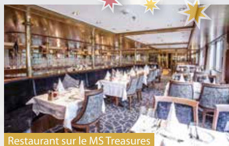
Restaurant sur le MS Treasures