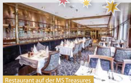
Restaurant auf der MS Treasures

Gut ausgeschlafen und gestärkt vom feinen Frühstücksbuffet an Bord heisst es, Abschied nehmen vom Schiff. Nach einer kurzweiligen Fahrt nach Colmar haben Sie die Gelegenheit, den stimmungsvoll geschmückten Weihnachtsmarkt in dieser schmucken Altstadt zu besuchen. Nutzen Sie die Gelegenheit, nochmals durch den Markt zu schlendern und Ihre letzten Einkäufe zu tätigen. Ihr zuvorkommender Chauffeur bringt Sie am Abend mit zahlreichen unvergesslichen Eindrücken und einer festlichen Weihnachtsstimmung zurück an Ihren ursprünglichen Einsteigeort.