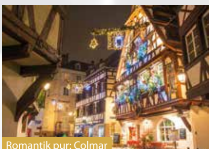
Romantik pur: Colmar

und schmackhaften Frühstücksbuffet stärken, passieren wir einige Schleusen und fahren an schönen Auenlandschaften vorbei. Um die Mittagszeit sind wir wieder zurück in Strasbourg. Nach dem Mittagessen haben Sie freie Zeit für einen gemütlichen Bummel durch den bekannten Weihnachtsmarkt. Seit 1570 entfaltet Strasbourg alljährlich den Weihnachtsmarkt rund um das prächtige Münster und macht ihn damit zu einem der ältesten und beliebtesten Weihnachtsmärkte Europas. Abends werden wir Sie wiederum mit einem mehrgängigen leckeren Abendessen an Bord verwöhnen. Anschliessend Big Party mit ChueLee!